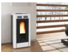
STUFE A PELLETT