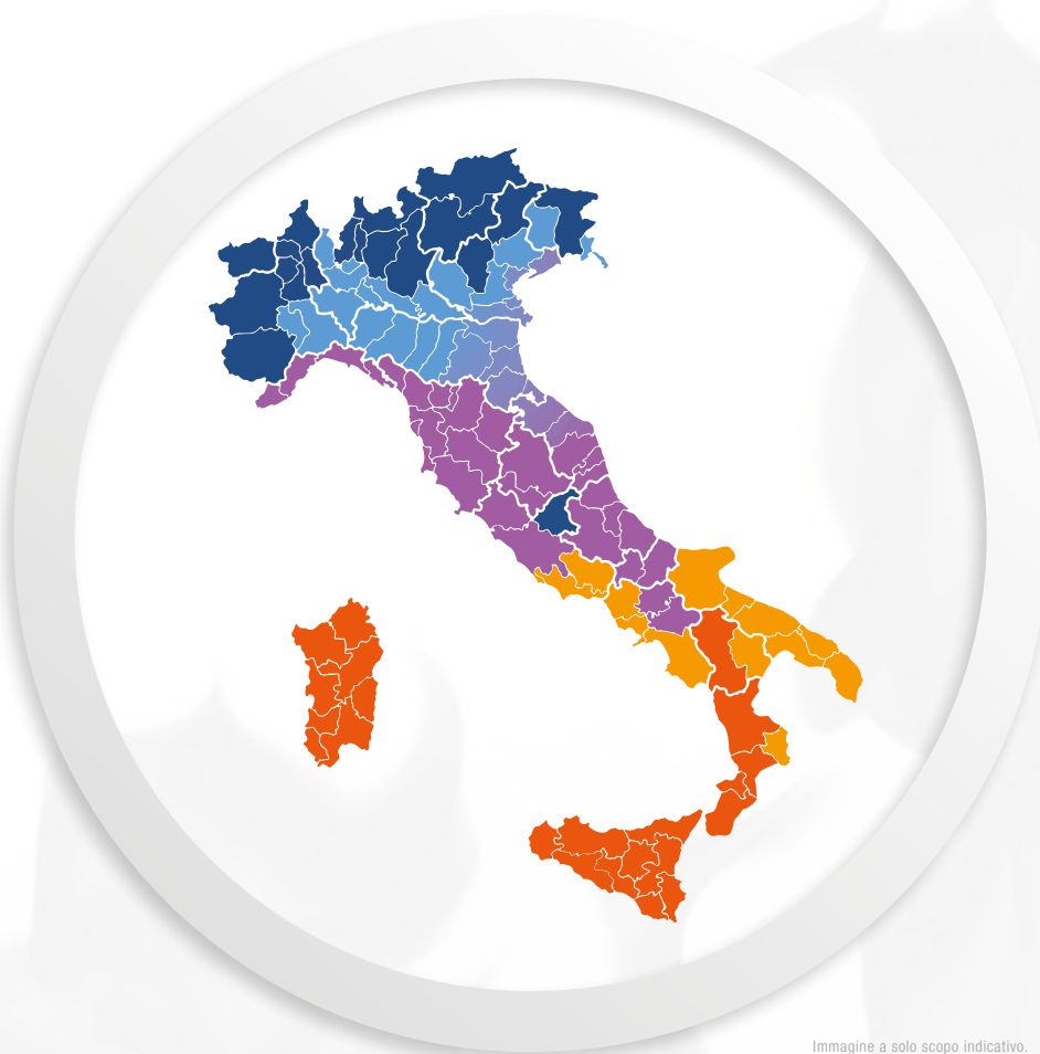
Immagine a solo scopo indicativo.

Il contributo dato dal Conto Termico varia secondo la potenza dell'apparecchio, le sue emissioni e la zona climatica dove è installato. Scopri precisamente in che zona sei: visita il sito www.lanordica-extraflame.com nella sezione dedicata al Conto Termico!