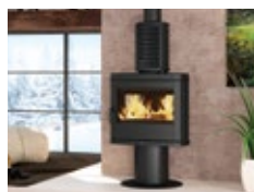
STUFE A LEGNA

Scopri tutti i modelli a legna e a pellet La Nordica-Extraflame che soddisfano i requisiti del Conto Termico 2.0 e calcola quanto puoi risparmiare.