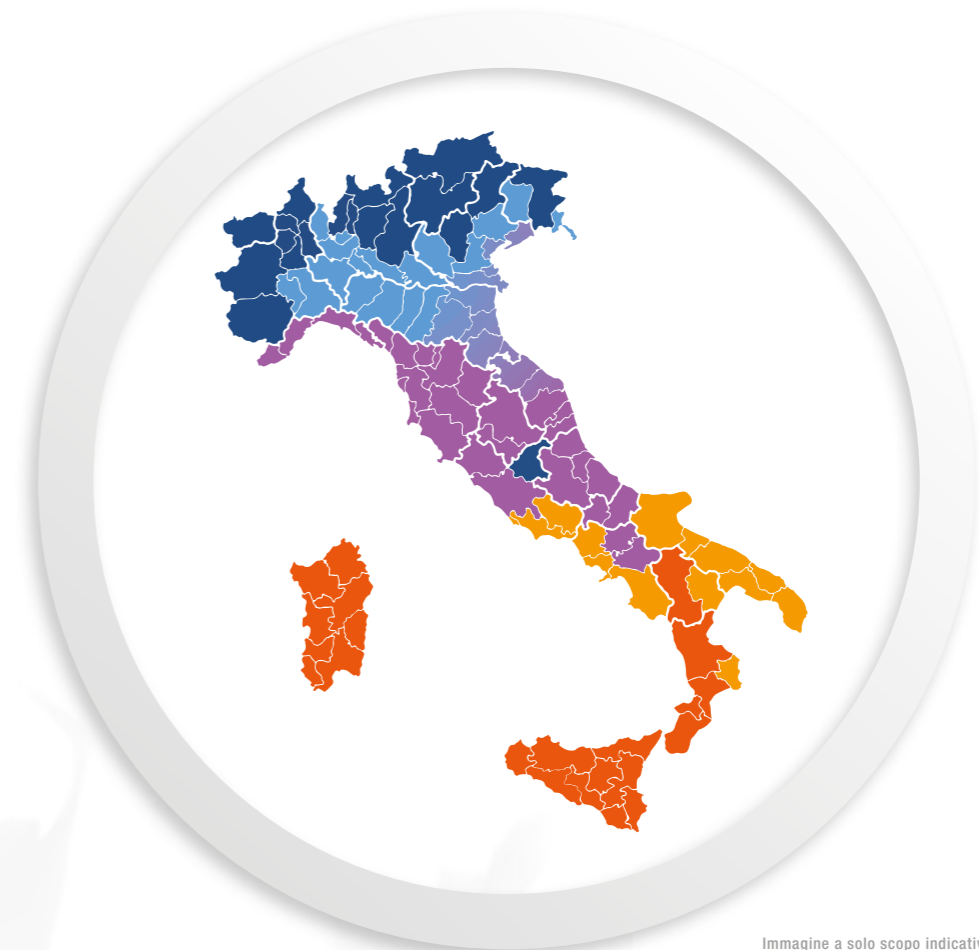
Immagine a solo scopo indicativo.

Il contributo dato dal Conto Termico varia secondo la potenza dell'apparecchio, le sue emissioni e la zona climatica dove è installato. Scopri precisamente in che zona sei: visita il sito www.lanordica-extraflame.com nella sezione dedicata al Conto Termico!