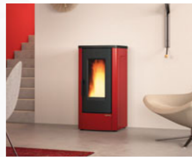
STUFE A PELLETT