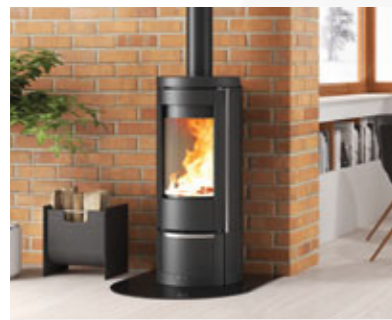
STUFE A LEGNA

Per poter usufruire degli incentivi previsti dal Conto Termico 2.0, il nuovo prodotto in sostituzione deve rispondere a particolari requisiti e standard qualitativi in termini di rendimento ed emissioni in atmosfera. Scopri tutti i modelli a legna e a pellet La Nordica-Extraflame che soddisfano i requisiti del Conto Termico 2.0 e calcola quanto puoi risparmiare.